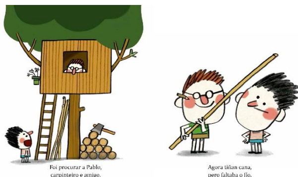
Foi procurar a Pablo, carpinteiro e amigo.

As ilustracións destacan pola expresividade dos personaxes e a súa potencia comunicativa. De trazos sinxelos, son estruturas deliberadamente básicas e imperfectas, con cores planas e alegres que acentúan o carácter lúdico do texto.