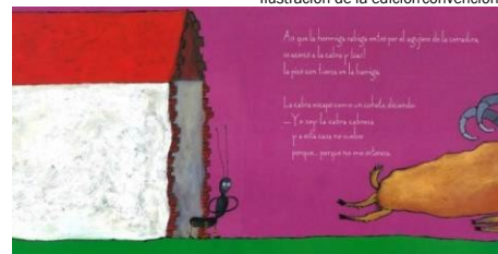
Ilustración de la versión adaptada