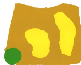
I el papà Groc i la mamà Groc van dir: «Tu no ets el nostre petit Groc, tu ets verd!»