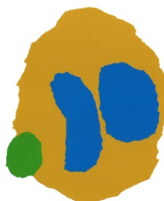
Però el papà Blau i la mamà Blau van dir: «Tu no ets el nostre petit Blau, tu ets verd!»