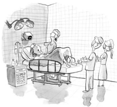
O NACEMENTO DE BARNABY

As ilustracións de Oliver Jeffers -a modo de sinxelas viñetas- transportan as lectoras e os lectores ata os escenarios e os episodios máis destacados na curta biografía deste mozo.