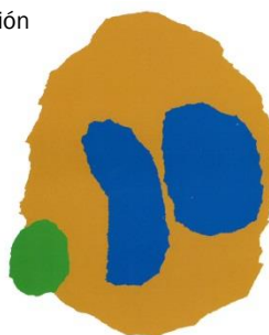
Pero Mamá Azul e Papá Azul dixerón: "Ti non es o noso Pequeno Azul, ti es verde!"