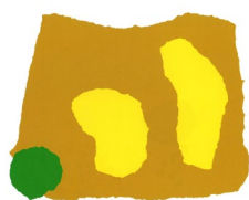
«O Pequeno Amarelo e a Mamã Amarela disseram: «Tu não és o mesmo Pequeno Amarelo. Tu és verde!».