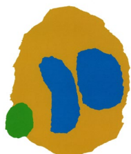
«Mas o Pequeno Azul e a Mamã Azul disseram: «Eu não sou o mesmo Pequeno Azul. Tu és verde!».

Sob a aparente simplicidade desta narrativa, subjaz uma história em que a amizade, a inocência, a identidade individual e coletiva são exaltadas, ao mesmo tempo que os primeiros leitores recebem uma valiosa lição sobre cores, tamanhos e direções. Se aplicada aos nossos dias, esta obra de Leo Lionni mostra-nos que não são as diferenças entre as pessoas que importam, mas valores como a solidariedade, a compreensão ou a convivência.